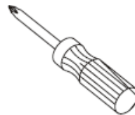
Phillips Screwdriver Tournevis cruciforme Destornillador cruciforme