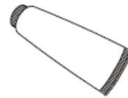
Silicone Sealant Enduit d'étanchéité au silicone Sellador de silicona