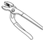
Groove Joint Pliers