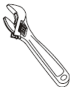
Adjustable Wrench Clé à molette Llave ajustable