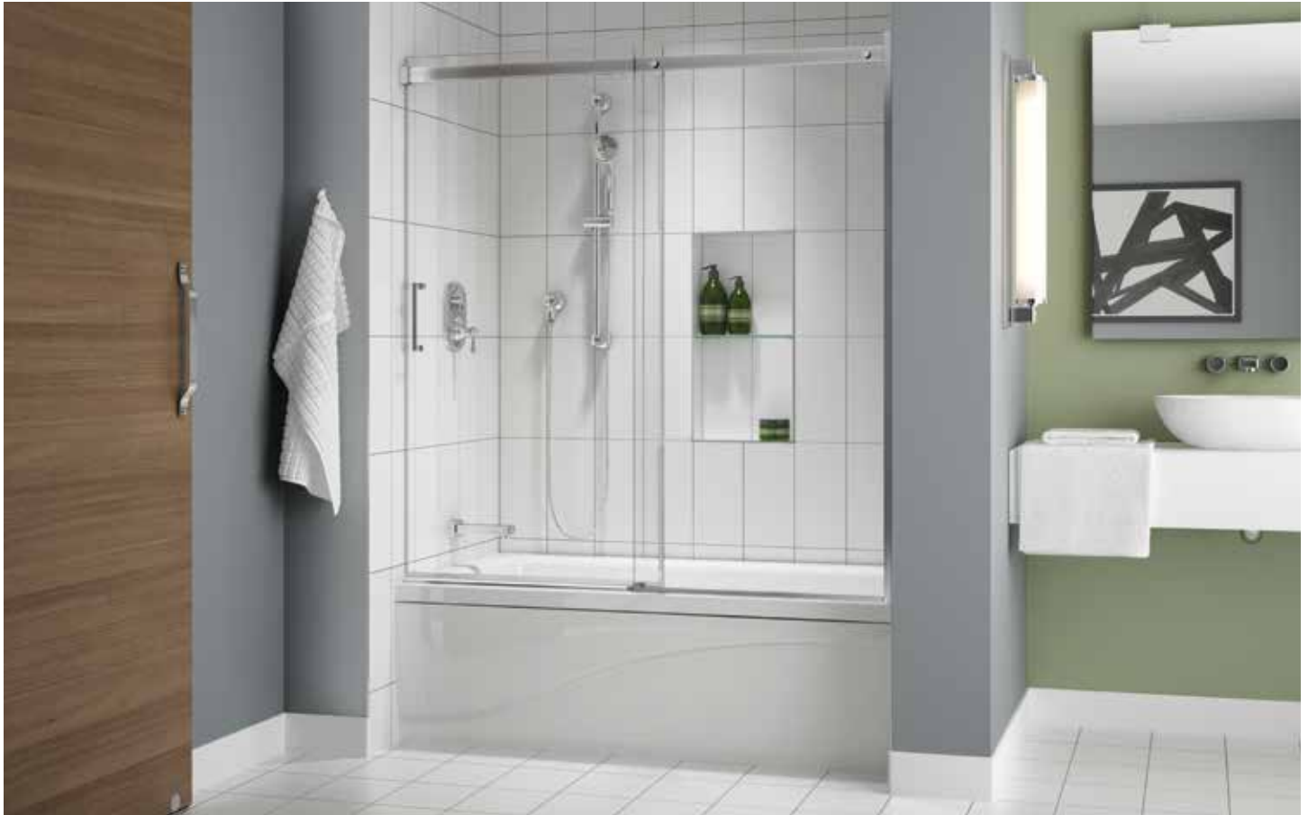
Model shown / Modèle présenté : NAST60-11-40L

Sliding door and fixed panel / Porte coulissante et panneau fixe