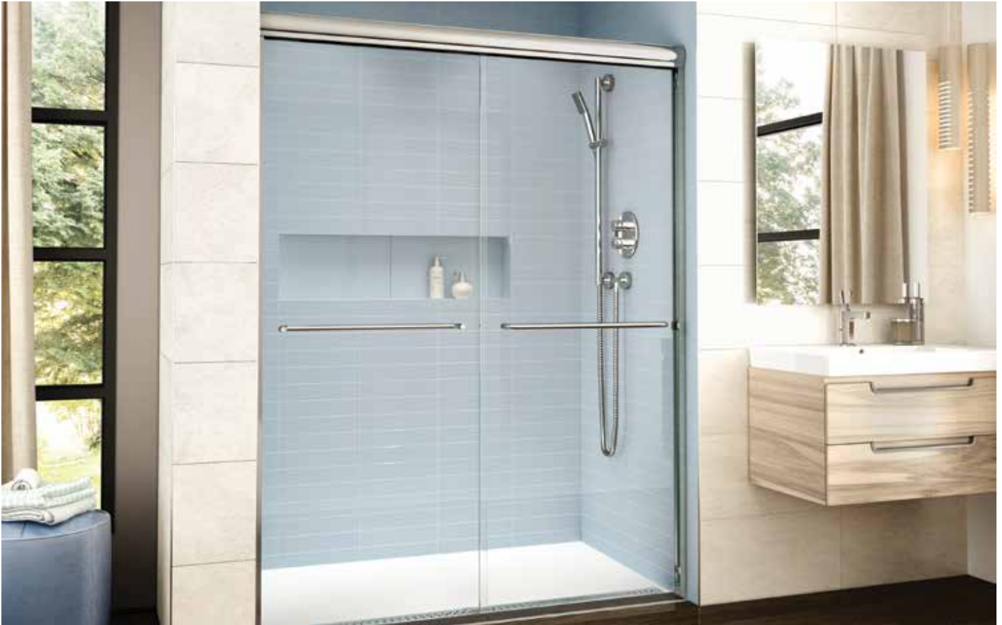
Model shown / Modèle présenté : CL161-11-40

Semi-frameless in-line sliding shower doors / Portes de douche coulissantes avec cadre partiel