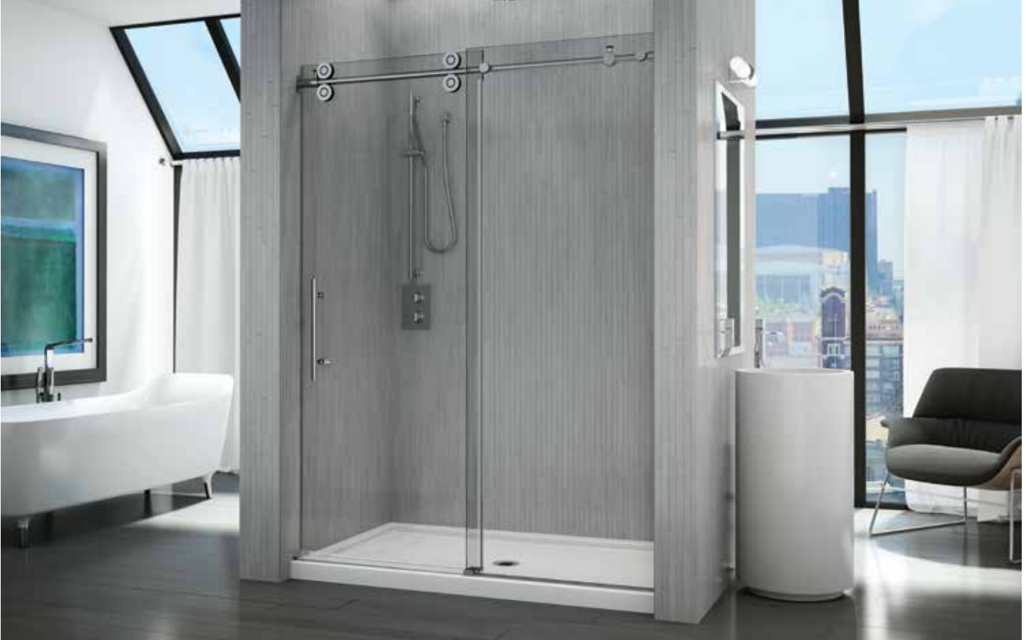
Model shown / Modèle présenté : KTA57-11-40

Sliding door and fixed panel / Porte coulissante et panneau fixe